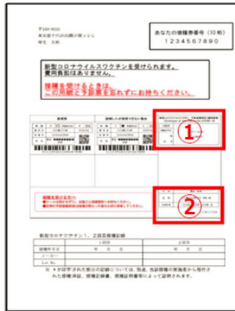
【予防接種済証（パターン2）】