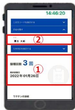
【新型コロナウイルスワクチン接種証明書アプリ】